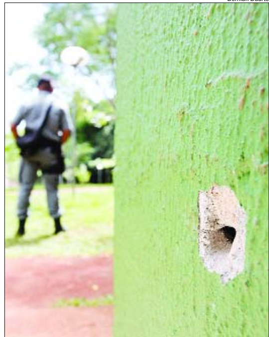
Marca de bala na parede da guarita da Guarda Municipal